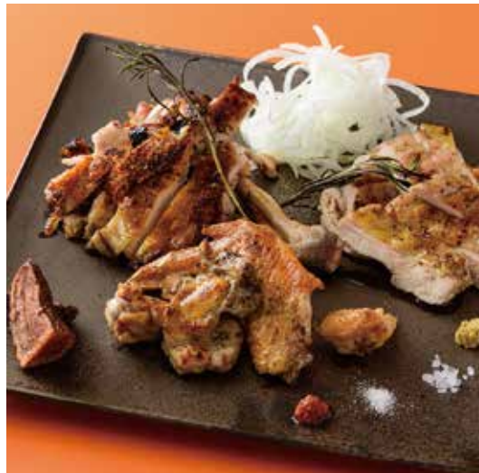
“丹沢滋黒軍鶏” 丸ごと半身の炭火焼き(雌)

Gizzard and Liver Boiled in oil Garlic and Peperoncino