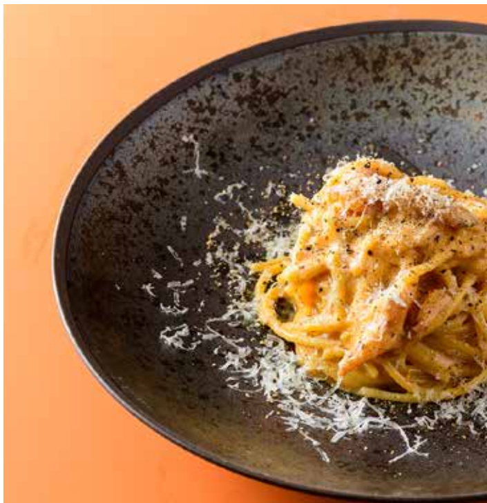
グアンチャーレと相模原恵壽卵のカルボナーラ スパゲッティ