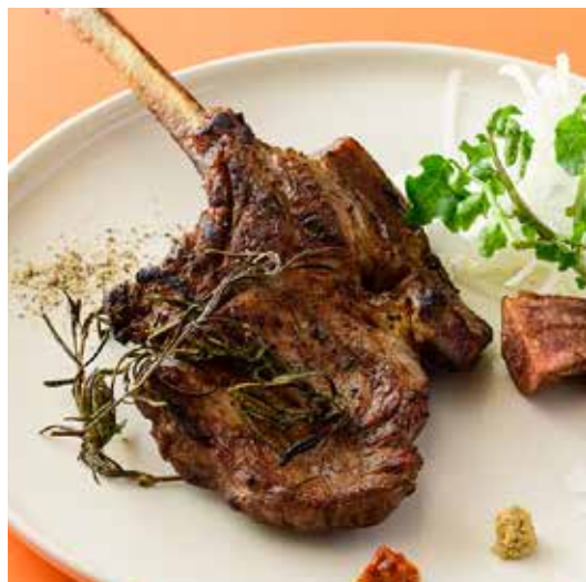
相模豚リブローズ“トマホーク”の炭火焼き