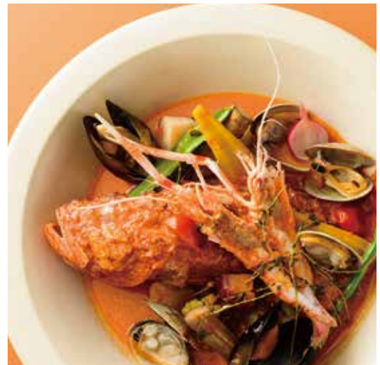
“ズッパ ディ ペッシェ”

鮮魚と魚介、赤海老の “ズッパ ディ ペッシェ” Fish and Seafood Stew “Zuppa di Peche” 2名様分 ¥2,980