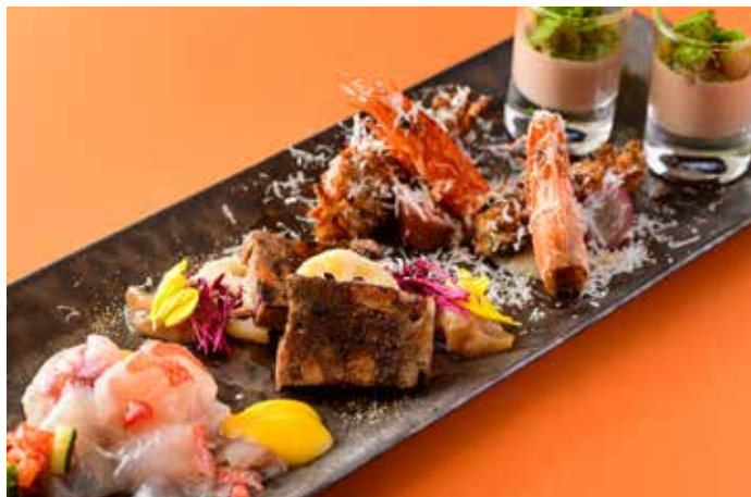
本日の前菜盛り合わせ 〈2名様分〉

Chicken Gizzard and Liver Boiled in oil Garlic and Peperoncino ¥1,980