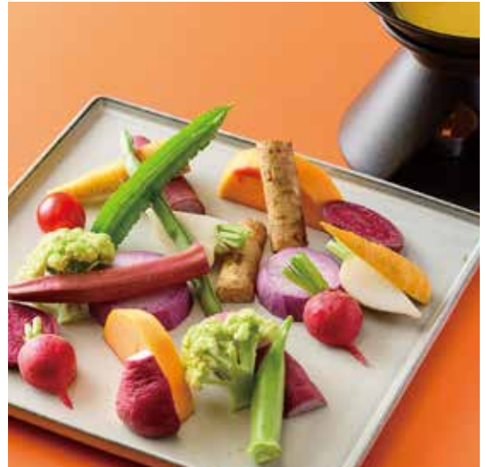
鎌倉野菜のバーニャカウダ

鎌倉野菜のバーニャカウダ 白味噌を使ったソース Bagna cauda of Kamakura Vegetables sauce using White Miso ¥1,780