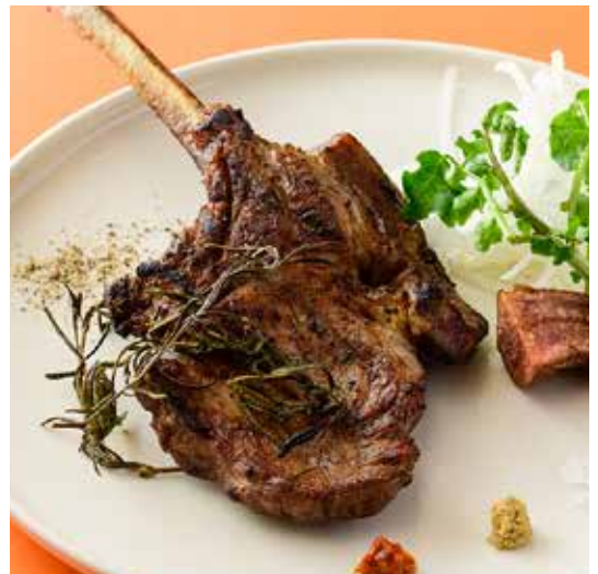
相模豚リブローズ“トマホーク”の炭火焼き

The price is about 300-400 grams per piece of meat.