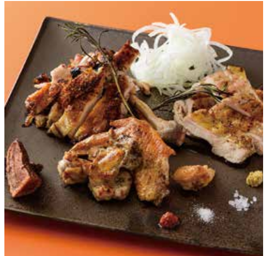
“丹沢滋黒軍鶏” 丸ごと半身の炭火焼き(雌)