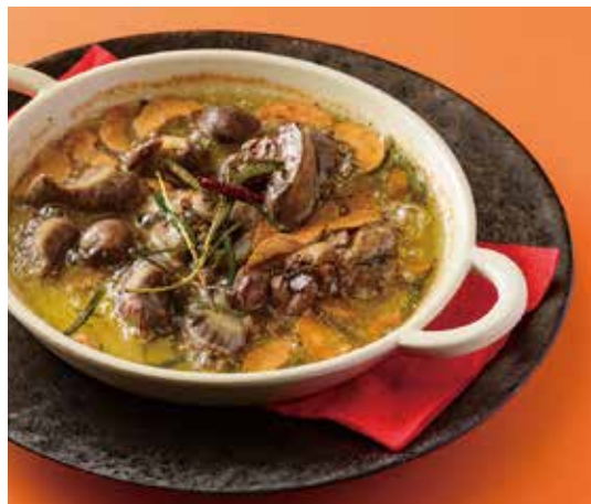
“丹沢滋黒軍鶏”砂肝とレバーのオイル煮 にんにくとペペロンチーノ