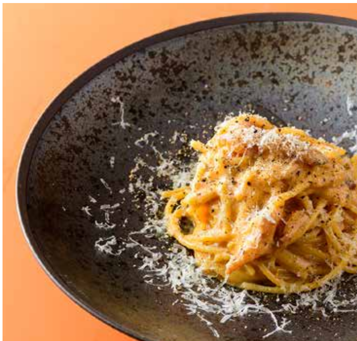
パンチェッタと相模原恵壽卵のカルボナーラ スパゲッティ